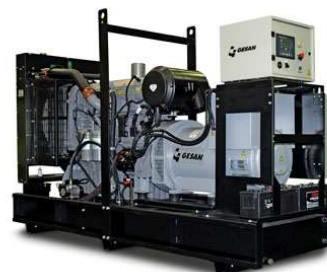
Модель открытого исполнения

Для уточнения Длительной мощности - COP (ISO 8528/1:2005) консультируйтесь у вашего дилера GESAN