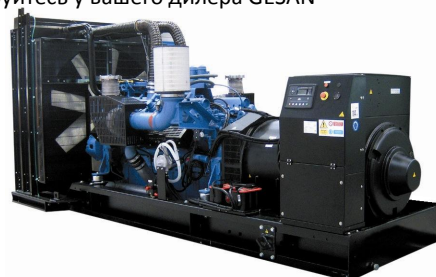
Модель открытого исполнения

Для уточнения Длительной мощности - COP (ISO 8528/1:2005) проконсультируйтесь у вашего дилера GESAN