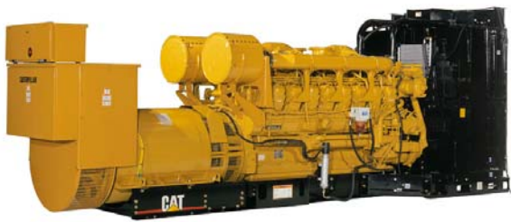
Генераторная установка показана с оборудованием, устанавливаемым по специальному заказу