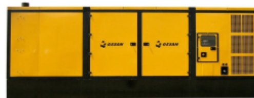
Модель кожухного исполнения

Для уточнения Длительной мощности - COP (ISO 8528/1:2005) консультируйтесь у вашего дилера GESAN