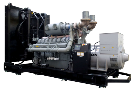
Модель открытого исполнения