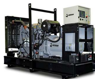
Модель открытого исполнения

Для уточнения Длительной мощности - COP (ISO 8528/1:2005) консультируйтесь у вашего дилера GESAN