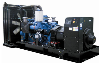
Модель открытого исполнения

Для уточнения Длительной мощности - COP (ISO 8528/1:2005) консультируйтесь у вашего дилера GESAN