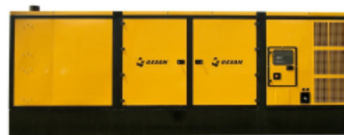
Модель кожухного исполнения

Для уточнения Длительной мощности - COP (ISO 8528/1:2005) консультируйтесь у вашего дилера GESAN